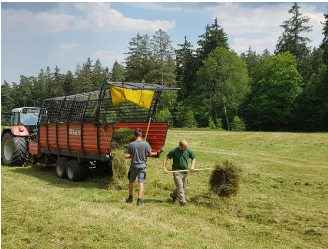
Mahdgutübertragung am Kienberg

Insgesamt betreute der LEV Maßnahmen und Verträge auf einer Fläche von rund 374 ha. Das Fördervolumen betrug insgesamt 372.635 €. Die nachfolgend abgedruckte Tabelle zeigt die Entwicklung der vom LEV umgesetzten Landschaftspflegemaßnahmen im Bereich der unteren Naturschutzbehörde (UNB) bzw. der unteren Landwirtschaftsbehörde (ULB).