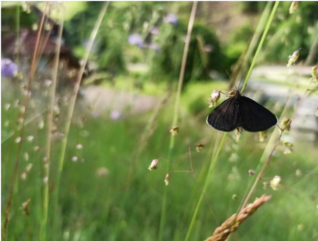
Kaminfegerle (Odezia atrata) an Mittlerem Zittergras (Briza media)

Gegen Ende des Jahres konnte durch die zwischenzeitliche Vollbesetzung der Geschäftsstelle gar ein komfortabler Vorsprung vor der eigentlichen Agenda herausgearbeitet werden, so dass im Dezember bereits ein Großteil der digitalen Vorbereitungen des KPP 2021 abgeschlossen werden konnte. Die weiteren gut 20 Maßnahmen außerhalb des KPP werden über die landwirtschaftliche Verwaltungsschiene betreut. Diese Projekte liegen auf Flächen innerhalb der Mindestflur oder der kommunalen Biotopvernetzung. Der Kern dieser Projekte ist häufig stärker landwirtschaftlich geprägt und dient vor allem der Offenhaltung der Landschaft. Dennoch spielen weitere Überlegungen des Naturschutzes und der Landschaftspflege auch hier eine Rolle.