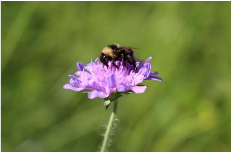
Ackerwitwenblume (Knautia arvensis) mit Besucher

schränkungen durchaus einen positiven Effekt. Im digitalen Raum kam es zu einem rasanten Innovationsschub, welcher mit Sicherheit bis weit in die Zukunft zu nennenswerten Einsparungen in der CO2-Bilanz führen kann - durch eine Teilnahme an Konferenzen, Besprechungen und Fortbildungen am heimischen Arbeitsplatz. Es wäre wünschenswert, wenn auch in Zukunft, im Hinblick auf Zeit- und Kosteneffizienz und eben durch die Einsparung fossiler Treibstoffe, die ein oder andere Präsenzveranstaltung als Online-Version durchgeführt werden könnte.