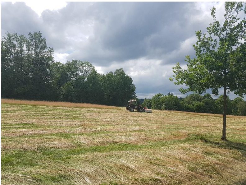
Archewiesen, Wiesenmäh Kienberg

Unteren Naturschutzbehörde und dem LEV und insbesondere auch mit den Bewirtschaftern vor Ort konnten im Rahmen dieses Projekts Flächen im Landkreis Freudenstadt durch artenreiches Saatgut aufgewertet werden. Das Projekt hat zum Ziel, Verfahren zu etablieren, um in verstärktem Maße Saatgut von sehr artenreichen Wiesen in geeignete verarmte Wiesen einzubringen – selbstverständlich im Einvernehmen mit den Bewirtschaftern und Eigentümern. Auch im digitalen Bereich konnte der LEV nachlegen. Neben vermehrten digitalen Lösungen des Landratsamtes zur flexiblen Telearbeit ist hier insbesondere auch der angestoßene Prozess des papierfreien Arbeitens zu erwähnen, welcher uns auch 2021 noch begleiten wird.