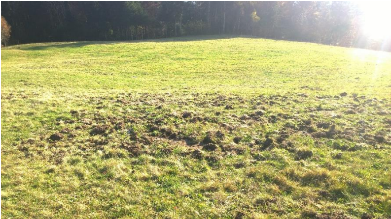
Engerlingsschaden in Bad Rippoldsau

Die vorhandenen Schadstellen können mit FFH-Saatgut, welches von der UNB zur Verfügung gestellt wird, wiederbegrünt werden. Das Saatgut wurde eigens für diesen Zweck beschafft und ist diesem auch vorbehalten. Bei diesem Saatgut handelt es sich um Samen von Wildblumen aus dem Schwarzwald. Eine Nachsaat mit normalen Grünland-Saatmischungen ist auf FFH-Wiesen nicht zulässig, da hierdurch die Artenvielfalt der Wiese gefährdet wird. Eine Bodenbearbeitung mit zweimaligem Grubbern vor der Ansaat ist sinnvoll, um noch im Boden befindliche Engerlinge zu dezimieren.