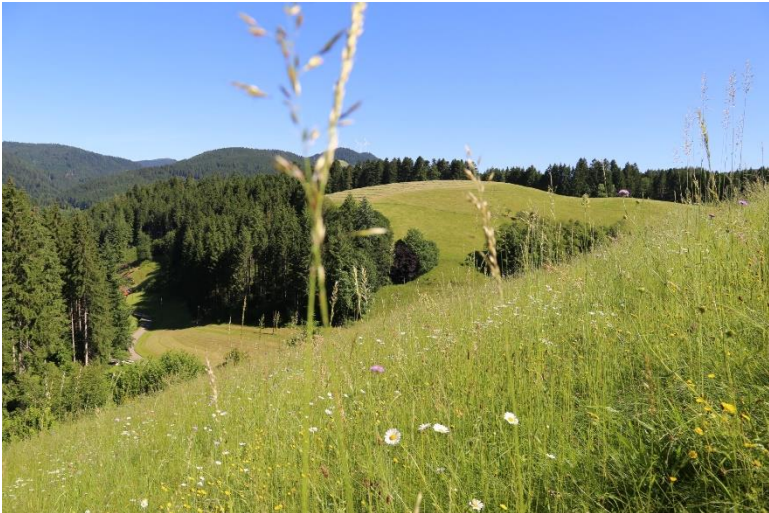
Artenreiche Glatthaferwiese in stark gegliederter Landschaft bei Bad Rippoldsau-Schapbach

Dabei sind Lösungen gefragt, welche auf Konsens bauen anstatt auf weitere Verbote zu setzen. An diesem Punkt wollen wir als LEV-Geschäftsstelle auch 2021 wieder anknüpfen, um nachhaltige Perspektiven anzubieten, die den Erhalt der biologischen Vielfalt auch betriebswirtschaftlich ein klein wenig attraktiver gestalten.