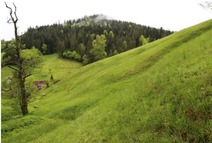
Artenreiche Wiese in stark gegliederter Hanglage

Den rechtlichen Rahmen der Förderung von Landschaftspflegemaßnahmen in Baden-Württemberg gibt die Landschaftspflegerichtlinie (LPR) vor. Hier werden die Ziele und Fördervoraussetzungen von Landschaftspflegemaßnahmen definiert. Das Gros der vom LEV betreuten Landschaftspflegemaßnahmen wird zunächst nach Teil B der Landschaftspflegerichtlinie als einjährige Maßnahme geplant und umgesetzt. Viele dieser einjährigen Maßnahmen haben sich bewährt. Deshalb wurden sie von Jahr zu Jahr verlängert. Ziel des LEV ist es, diese bewährten Maßnahmen sukzessive in verlässliche fünfjährige Pflegeverträge nach LPR Teil A umzuwandeln. Das hat nicht nur den Vorteil der größeren beiderseitigen Planungssicherheit, vielmehr können so auch mühsam erarbeitete Naturschutzleistungen der Bewirtschafter in einem langfristigen Kontext verstetigt werden.